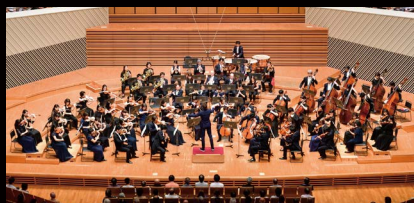
管弦楽：東京交響楽団