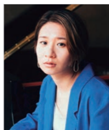
桑原 あい KUWABARA Ai (ジャズピアニスト) (Jazz Pianist)

ジャズ・ピアニスト、作曲家。1991 年生まれ。これまでに 10 枚のアルバムをリリースし、JAPAN TIMES ベスト・アルバム (ジャズ部門) など受賞多数。またモントルー・ジャズ・フェスティバルや東京 JAZZ、アメリカ西海岸ツアーなど国内外を問わずライブ活動を精力的に行う。その他テレビ朝日系報道番組「サタデーステーション」「サンデーステーション」のオープニングテーマ、J-WAVE「STEP ONE」のオープニングテーマなどその活動は多岐にわたる。また世界的プレイヤーであるスティーヴ・ガッド、ウィル・リーとのトリオで 2 枚のリーダーアルバムをリリースするなど、今もっとも注目を集めるジャズ・ピアニスト。