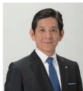
ヤマハ音楽振興会 理事長

Last but not least, I would like to express my sincere appreciation to everyone who has made this concert possible during the unforeseen situation caused by the COVID-19 pandemic. Thank you all very much.